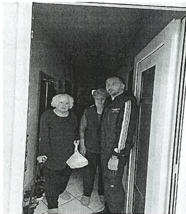
Fotografija 1: Dostava toplog obroka